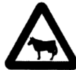
71) – Animais