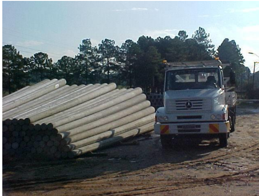
Foto 1 – Posicionamento do veículo e pilha de postes no depósito.